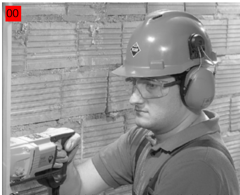
Los equipos de protección individual, compañeros indispensables del profesional.

En los últimos años, la proliferación de normas de seguridad ha hecho que se generalice el uso de equipos de protección. En el caso de los colocadores cerámicos, existen múltiples productos que preservan todas las partes del cuerpo del usuario y cuyo uso es altamente recomendable, aunque en muchos casos voluntario. Rubi dispone en su catálogo de un amplio surtido de artículos de seguridad.