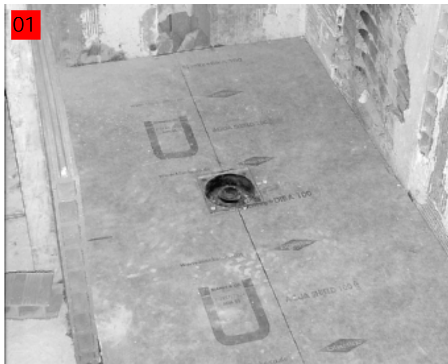
'Platospacio' está fundido en una sola pieza y su diseño simplifica su instalación en obra.